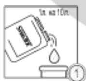
Шаг 1 - Приготовление промывочного раствора