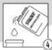
Шаг 4 - Нейтрализация кислотности теплообменника