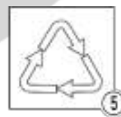
Шаг 5 - утилизация промывочного раствора